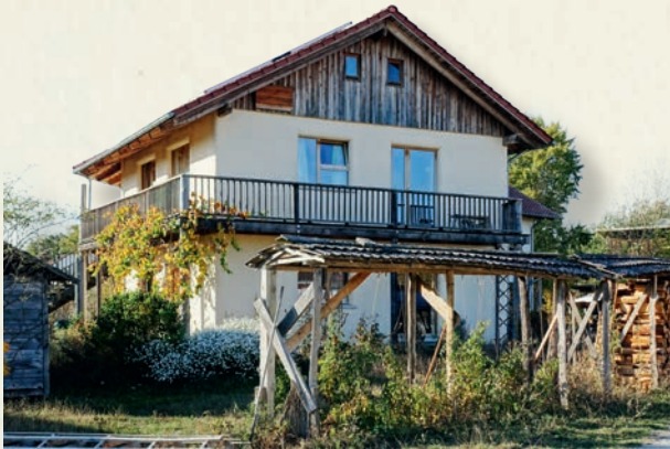
Strohballenhaus Sieben Linden

Eigenleistungen sind gut integrierbar, so dass Sie sich am Ende in Ihren eigenen vier Wänden rundum wohl fühlen und sich mit ihrem Haus identifizieren können!